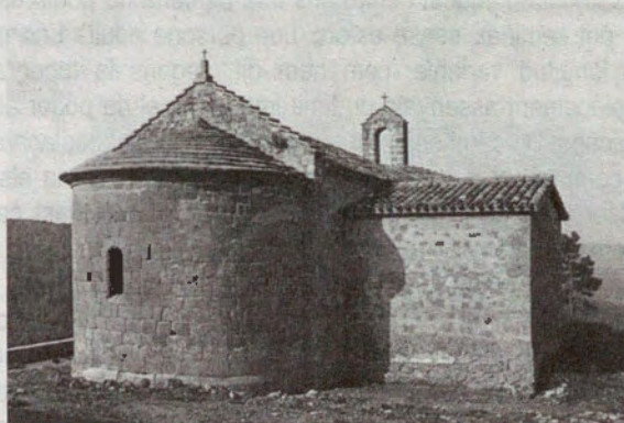
Vista de Sant Martí de Biure

Vam publicar en les Circulars números 217 (novembre 2002) i 223 (maig 2003), una breu monografia d'un temple parroquial, Sant Martí de Biure (Sagàs, Berguedà) d'una sola nau, més tard convertit en una església sufragània i a l'actualitat una simple ermita. Sant Martí de Biure no té una trajectòria històrica singular, sinó una de molt típica de moltes de les comunitats parroquials romàniques, i que podem valorar com a contraposat al proper temple parroquial de Sant Andreu de Sagàs, de planta basilical, que és un exemple ben clar de l'edifici solemne i del que no en sabem la personalitat del seu mecenes, atès que la comunitat parroquial de Sant Andreu era més rica, però no pas tant per poder-se permetre la construcció d'un temple tan solemne. El primer és un temple sense continuïtat parroquial i el segon és el cas d'una parroquia sense grans possibilitats econòmiques, però que va poder edificar un temple de planta basilical que és quelcom extraordinari, almenys dels conservats, entre les esglésies romàniques catalanes.